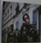
... ... ...