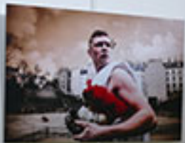
... ... ...