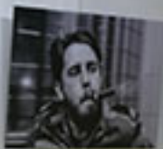
... ... ...