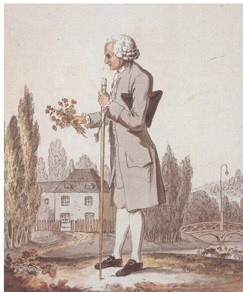
L'auteur des Confessions devant le pavillon qu'il habitait à Ermenonville.