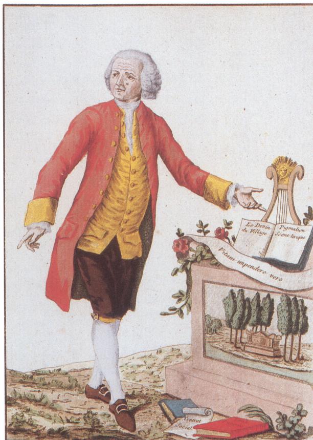
Âgé de 66 ans, Rousseau est représenté ici entouré de ses œuvres : Le Devin du village , Pygmalion , Le Contrat social et L'Émile .